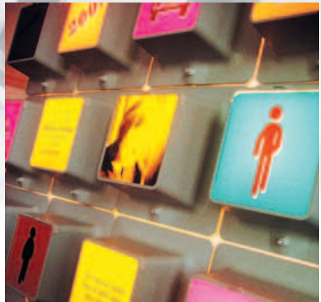
Panneau lumineux ludique pour attirer le regard sur le Mobility-Jackpot.

Le Mobility-Jackpot est une entrée en matière idéale pour sensibiliser vos collaborateurs pendulaires à remettre en question leur comportement de mobilité. En tout