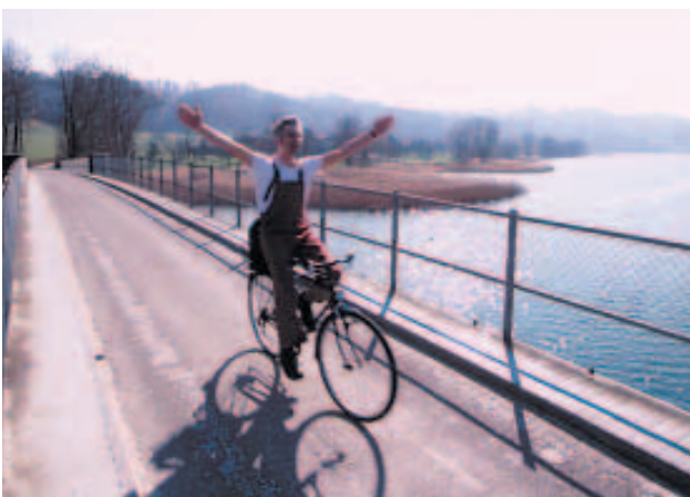
Le vélo est plus qu'un moyen de transport, c'est un plaisir.

Savez-vous combien de trafic engendre votre entreprise? Et dans quelle mesure les bouchons et le manque de parkings portent préjudice à l'emplacement de votre entreprise? Cela peut être clairement analysé et systématiquement amélioré – c'est exactement ce en quoi consiste le management de mobilité. Sans trop de charges sur l'entreprise, l'environnement et le voisinage, il est possible de mettre en place une mobilité sans difficultés. Ainsi, des potentiels d'efficacité considérables peuvent